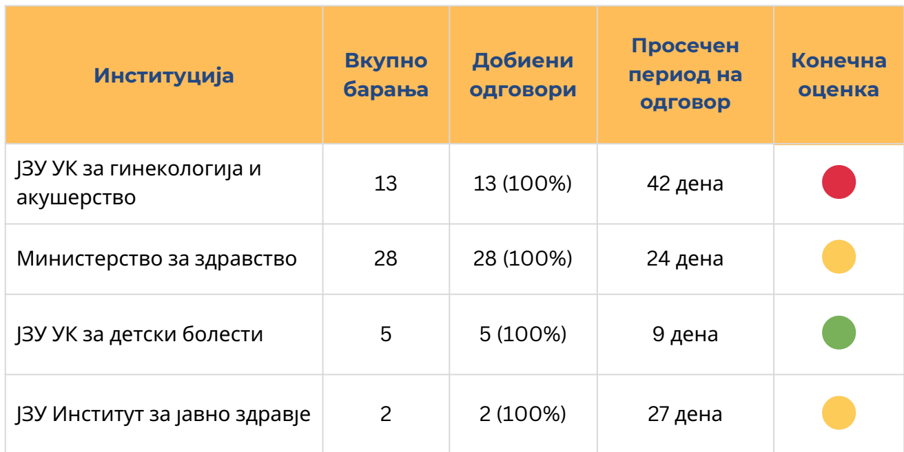
Табела 1. Приказ на нивото на реактивна транспарентност